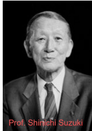
Prof. Shinichi Suzuki

Glöm inte att skriva för- och efternamn samt vilket instrument barnet/ barnen spelar.